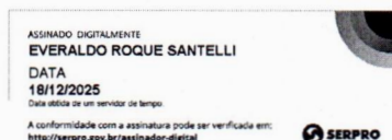
EVERALDO ROQUE SANTELLI MEMBRO