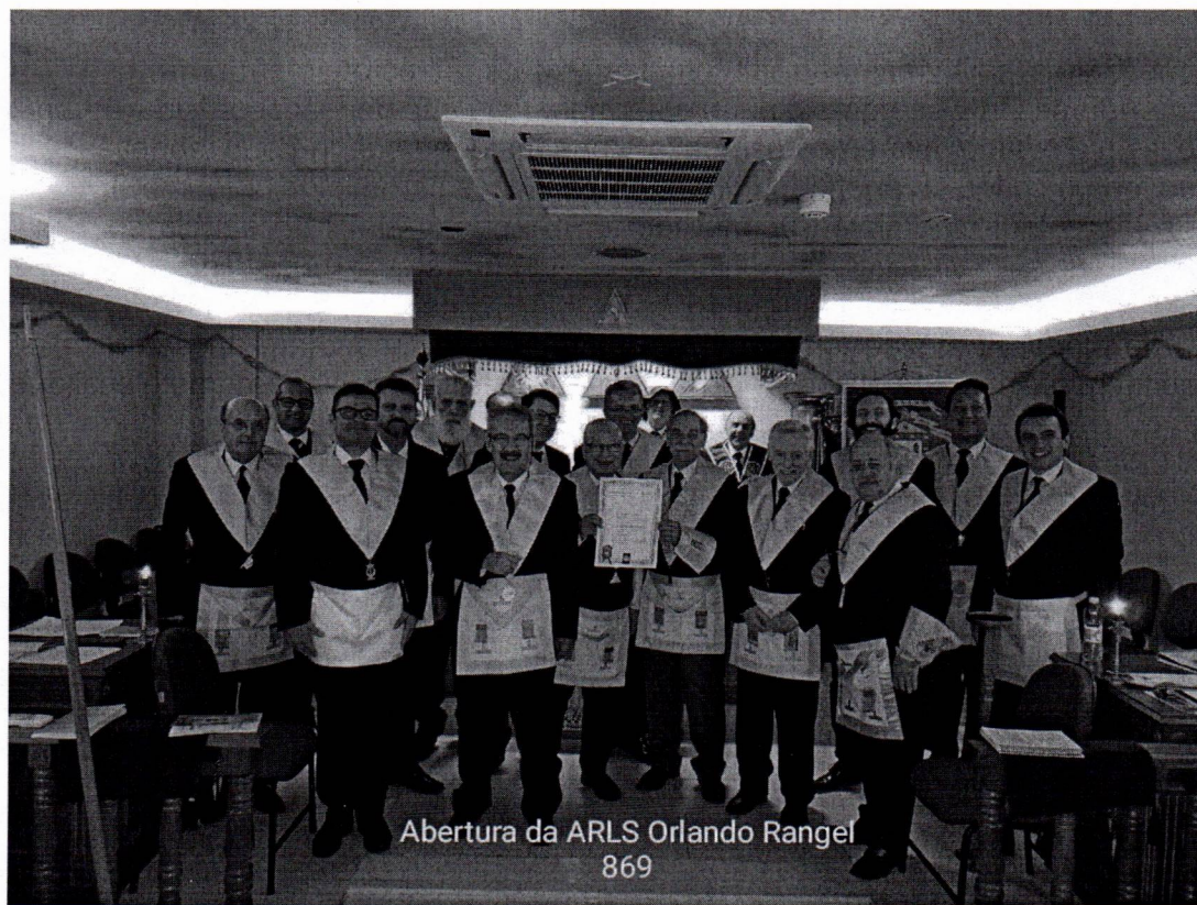
Abertura da ARLS Orlando Rangel 869

Fazia parte da Loja Maçônica, onde foi Venerável Mestre de 2010 a 2011. Foi investido no Grau de Grande Inspetor Geral, 33º em 13 de julho de 2013 e, em 2019, João e outros maçons fundaram a loja "ARLS Orlando Rangel 869".