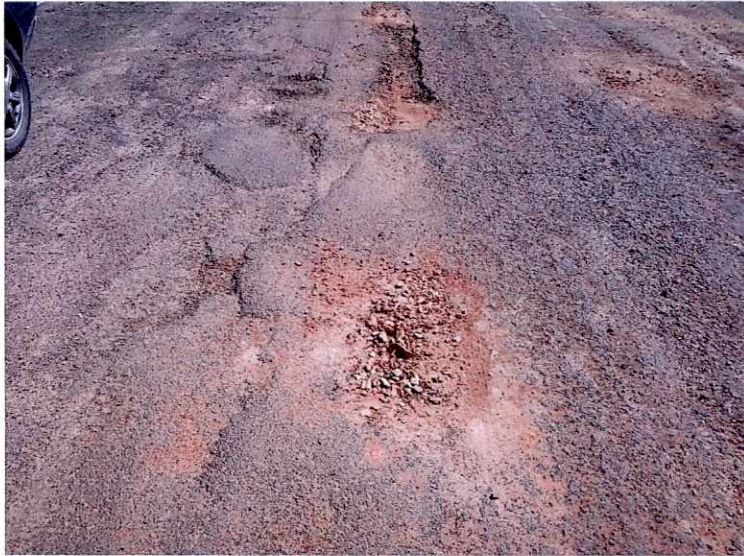
e Salvador Sanches Bairro Vista Alegre